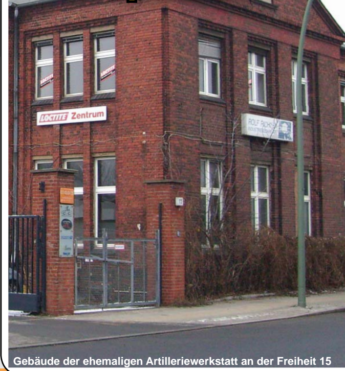
Gebäude der ehemaligen Artilleriewerkstatt an der Freiheit 15